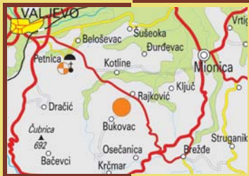
ILUSTRACIJE NA OVOJ STRANI: ⇨ Srebrni dugmetasti predmet otkriven u humci 1 ⇨ Karta položaja lokaliteta ⇨ Pozdrav iz Bukovca. PHOTOS AND DRAWINGS ON THIS PAGE: ⇨ Silver button-like object found in earth-mound No. 1 ⇨ Site map ⇨ Greetings from Bukovac.