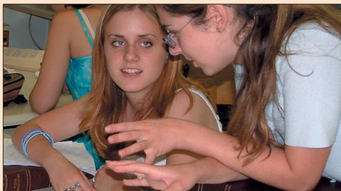
Petnica 19 sa dodatkom "Web Odiseja 2003" štampani su zahvaljujući podršci švajcarske organizacije za razvoj SDC